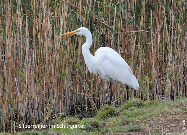
Silberreiher im Schilfgürtel