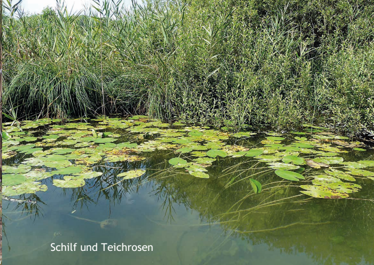
Schilf und Teichrosen